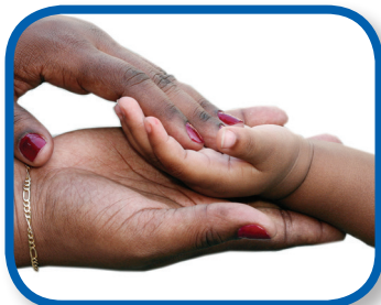
Dedos de las manos y de los pies De 3 a 9 meses