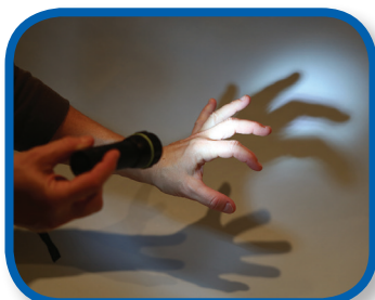
Dedos de araña De 6 a -12 meses