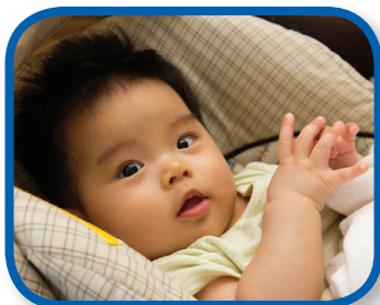
Movimientos de las manos De 3 a 9 meses