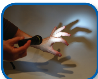
Spider Fingers 6-12 months