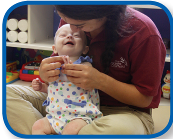
Este cerdito De 0 a 6 meses